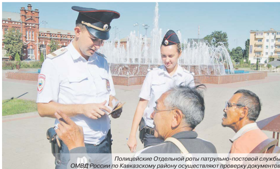
Полицейские Отдельной роты патрульно-постовой службы ОМВД России по Кавказскому району осуществляют проверку документов